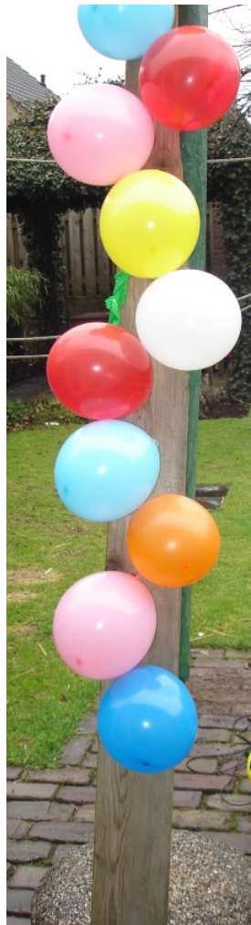
Foto totempaal met ballonnen